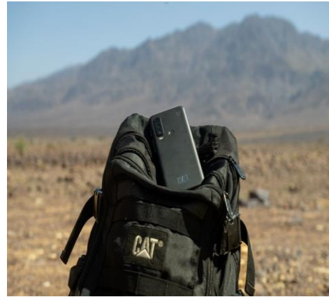
Smartphone CAT + antenna satellitare. CAT62Pro telecamera FLIR