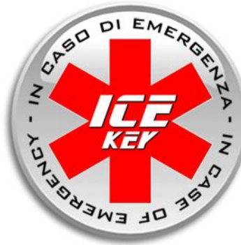
Marchio Chip NFC Icekey